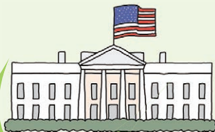
ホワイトハウス高官