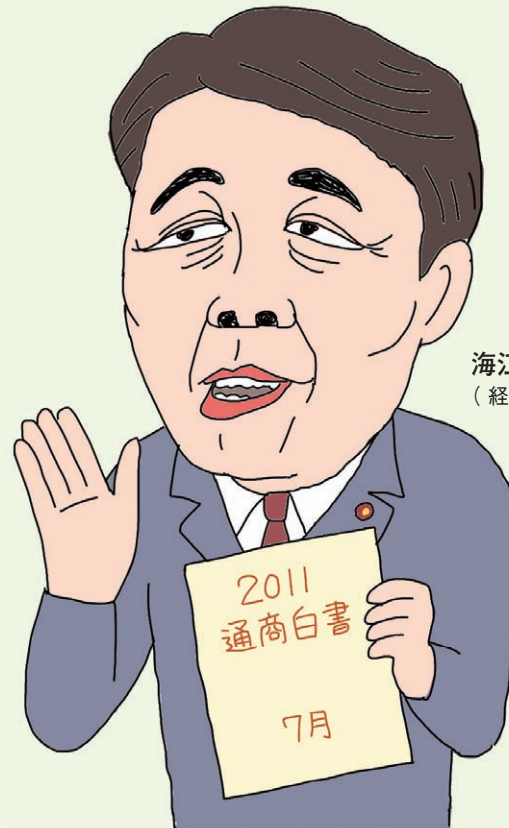
海江田万里 ( 経済産業大臣 )

東日本大震災を乗り越え、日本経済を再生させるには、輸出競争力を一層高めるべき。そのためにはTPPなど経済連携の強化が必要である。(一部を要約)