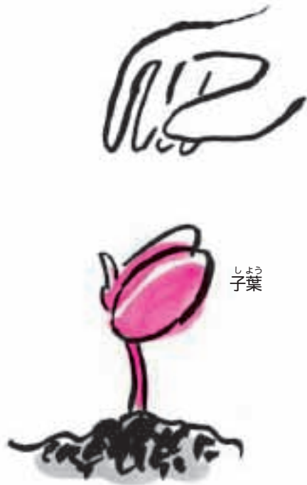
① 子葉がひらきかけたと き、子葉を手でとる。

おやしゅけい 親(主茎) はなくても、 こぶんしそだ 子(分枝)は育つ なえ 苗のそれぞれの時期に、主茎を切って えだ 枝のでかたを観察してみよう。