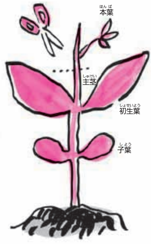
③ 本葉がひらきかけたら、そ の下で主茎を切る。

ダイズ以外の植物でも主茎を切っても、分枝や分けつがでてくるけれど、たいていは主茎の生長より元気がない。ところがダイズのはあい、主茎にまけないくらいりっぱな分枝がでてくるんだ。ただし芽がでてはやい時期に子葉(タネ)をとってしまうと、生長がとまってしまふよ。